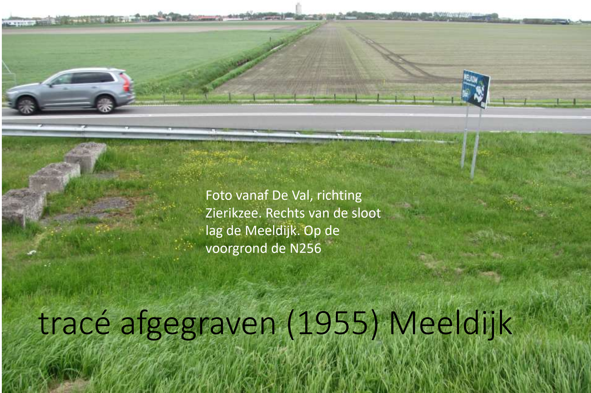
Foto vanaf De Val, richting Zierikzee. Rechts van de sloot lag de Meeldijk. Op de voorground de N256