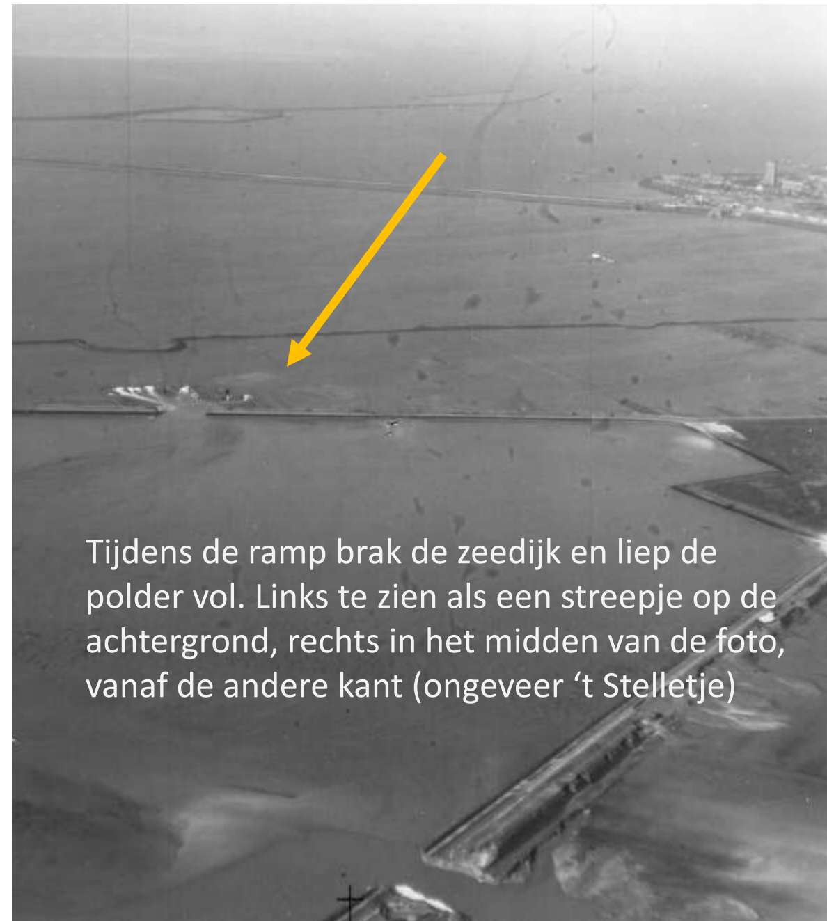
Tijdens de ramp brak de zeedijk en liep de polder vol. Links te zien als een streepje op de achtergrond, rechts in het midden van de foto, vanaf de andere kant (ongeveer 't Stelletje)